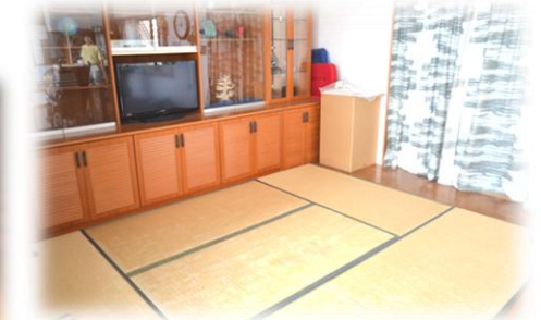
← ●食堂 ↑ ●居間